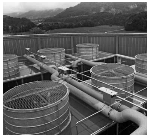
Torre di raffreddamento ibrida.

Sui soffitti raffreddanti può condensare l'aria umida del locale. Negli impianti di raffreddamento (ad es. torri di raffreddamento aperte, refrigeratori ad acqua) c'è il rischio che si formino dei germi (vedi SITC 2003-3, impianti di raffreddamento).