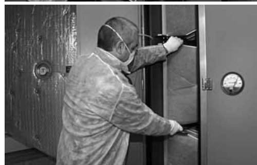
I filtri devono essere sostituiti regolarmente.