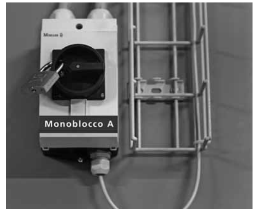
Blocco dell'impianto con un lucchetto specifico.

Bloccando l'impianto si evita ad esempio che, durante i lavori di manutenzione, parti del corpo, capelli o indumenti possano restare impigliati o essere trascinati in seguito all'avviamento accidentale dell'impianto.