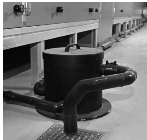
Sifone centrale per acqua di condensa.

Avvertenza: nei sistemi di distribuzione dell'aria meglio evitare qualsiasi isolamento interno (vedi SITC VA104-01).