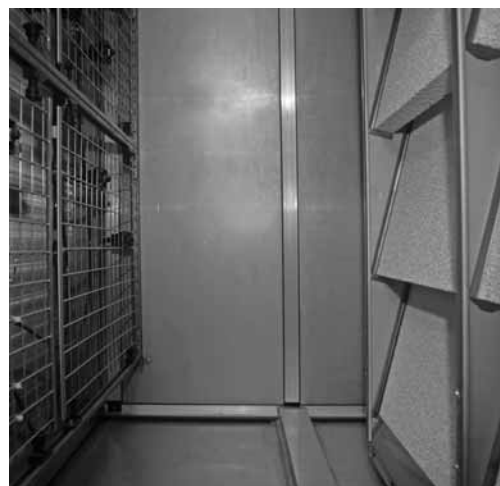
Interno di un umidificatore ibrido. Lo stato d'igiene deve essere controllato periodicamente.

Avvertenza: durante i lavori di manutenzione bisogna tenere spente le lampade UV.