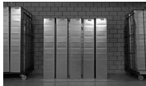
Canali dell'aria prima del montaggio; depositati in modo ordinato e pulito.

Nei silenziatori possono formarsi depositi di polvere, mentre l'umidità e l'acqua di condensa favoriscono la formazione di germi.